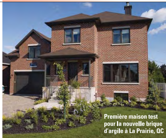
Première maison test pour la nouvelle brique d'argile à La Prairie, QC

Il n'y a pas que YouTube et FaceBook qui prennent de plus en plus de place sur le Web. La fréquentation de notre site, www.suretouch.ca a augmenté de plus de 80 % en un an !