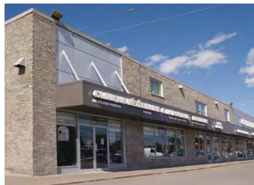
Centre commercial à Neufchatel en périphérie de Québec

Qu'il s'agisse de rénovation ou de construction neuve, SureTouch fait de plus en plus partie du paysage dans les projets institutionnels, commerciaux et industriels.