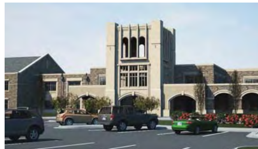
Richland High School

SureTouch a été choisi dans le cadre d'un important projet institutionnel, une école secondaire à Richland en Caroline du Sud. Une commande de 150 000 pi. ca. !